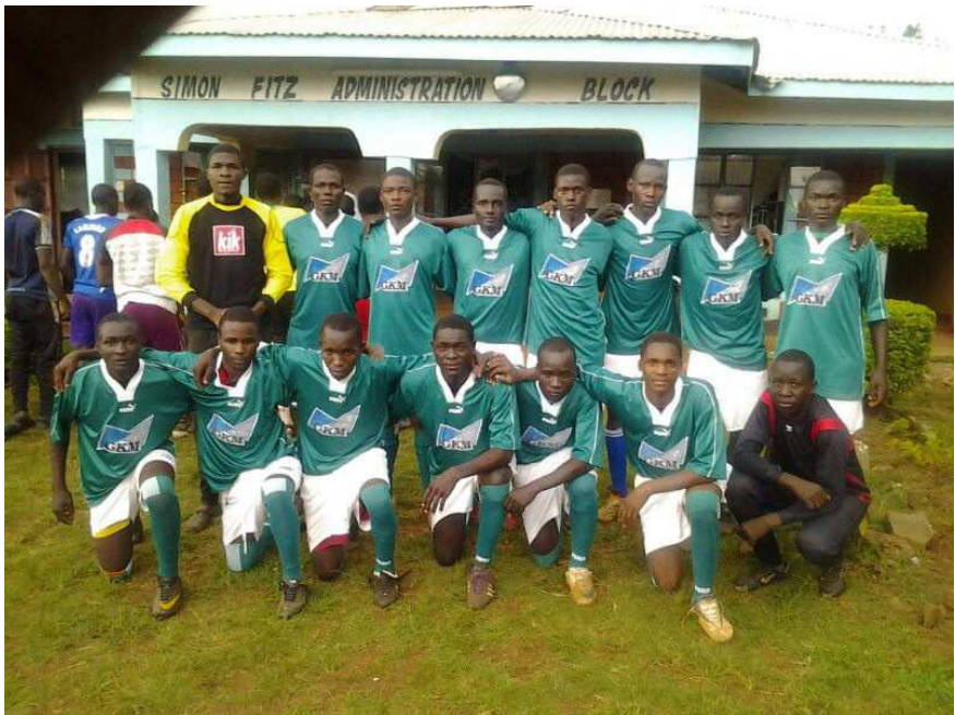
Bild von der Schulmannschaft der St. Juliane Ugari Mixed Secondary School