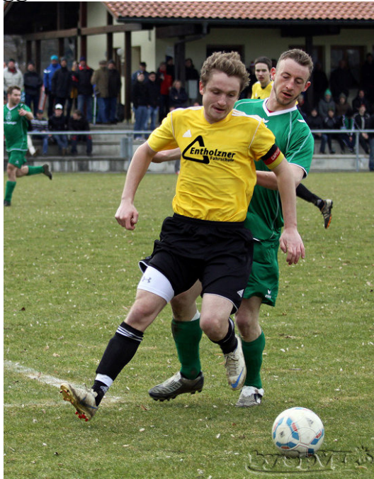
Bild vom Derby 2012/13

SpVgg Pittenhart 2 – DJK SV Griesstätt 2